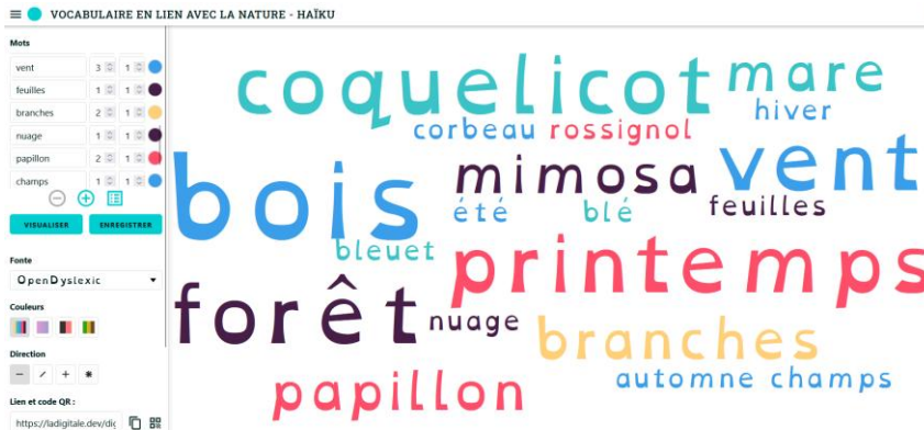
Exemple de nuage de mots avec l'outil gratuit Digiword de La Digitale

De la même manière, tous les mots en lien avec la nature sont conservés sur un autre document.