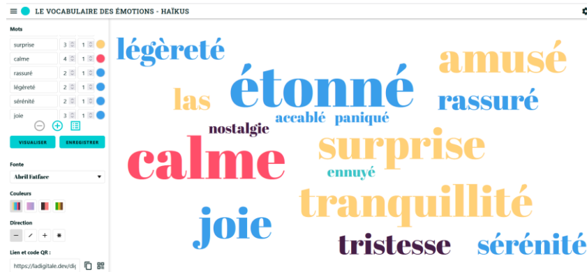
Exemple de nuage de mots avec l'outil gratuit Digiword de La Digitale

De la même manière, tous les mots en lien avec la nature sont conservés sur un autre document.